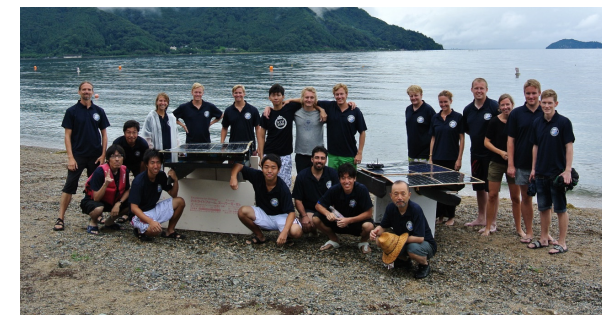
ソーラーボートプロジェクト with スウェーデン王立工科大学