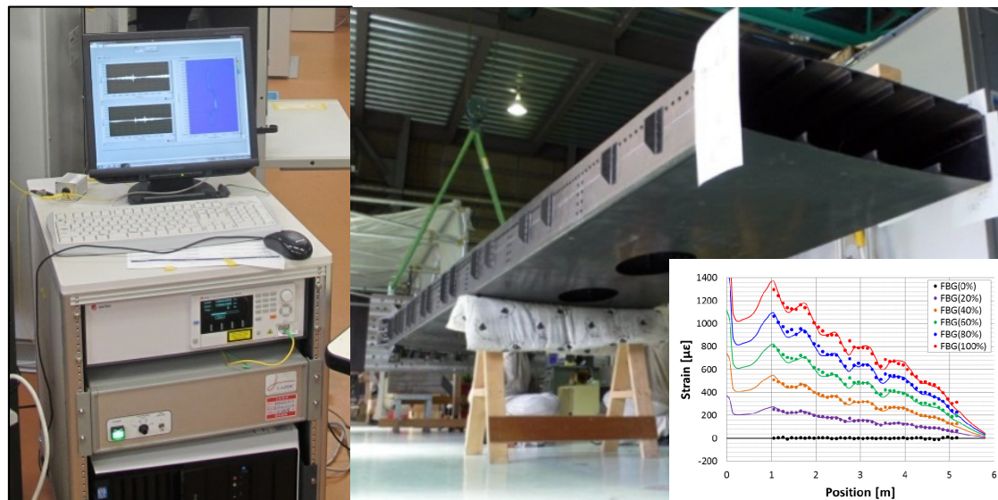
光ファイバセンサによるCFRP翼構造モニタリング