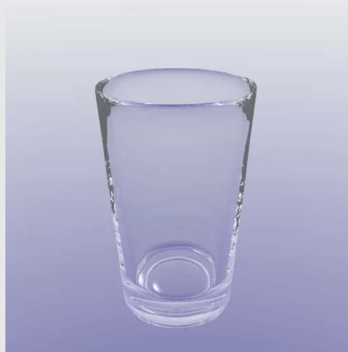
コンピュータグラフィックス